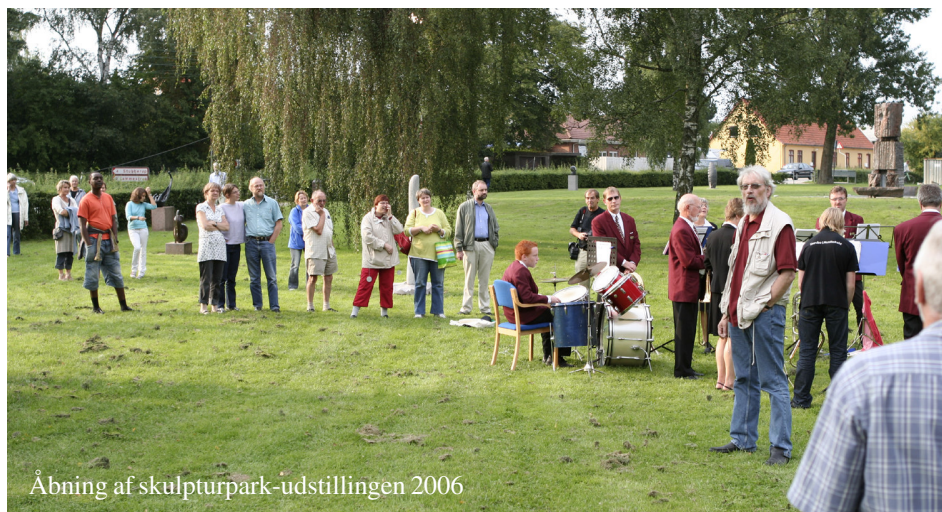
Åbning af skulpturpark-udstillingen 2006

Nu kan arbejdet gå videre, og vi håber at de første skulpturer kan afsløres i forbindelse med Kulturatten i Borup den 24. august.